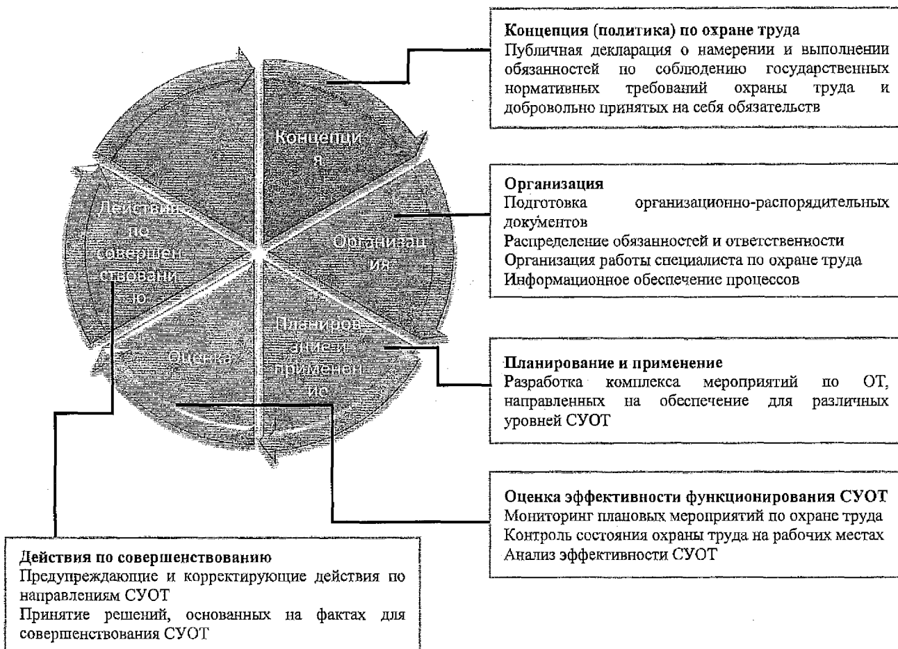
Рис.1. Основные элементы системы управления охраной труда.

Основные элементы системы управления охраной труда, направленной на непрерывное совершенствование, представлены на рис.1.